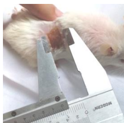
Gambar 1. Pengukuran Luas Luka Bakar